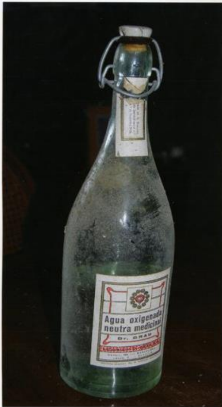
AGUA OXIGENADA NEUTRA MEDICINAL Dr. Grau. Año 1926 Barcelona – Sevilla