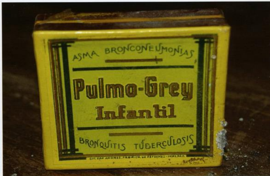
Foto 5 Pulmo Grey Infantil. Medicina periodo de Alfonso XII (1874 – 1885). Libro Trabajando por la salud, página 31