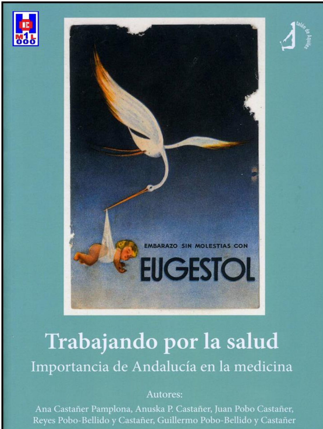
Foto 1 Portada del libro Trabajando por la salud