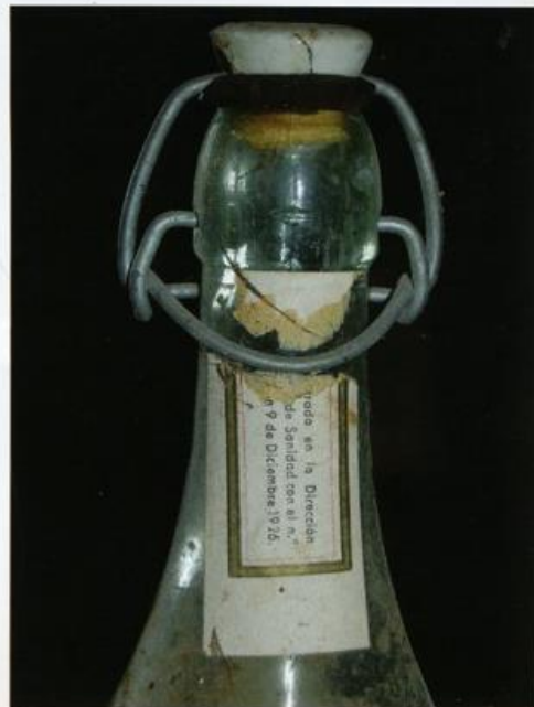
Foto 6 Agua Oxigenada Neutra Medicinal. Medicina periodo de Alfonso XIII (1886 – 1931). Libro Trabajando por la salud, página 48