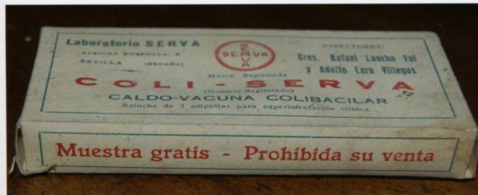
Foto 4 Coli – Serva. Medicina periodo de Isabel II (1833 – 1868). Libro Trabajando por la salud, página 25

También hay que resaltar la serie de medicamentos y medicinas que, a algunos boticarios les podrán recordar tiempos pasados y que los delegados de los laboratorios farmacéuticos entregaban y enviaban al médico, exaltando sus cualidades curativas.